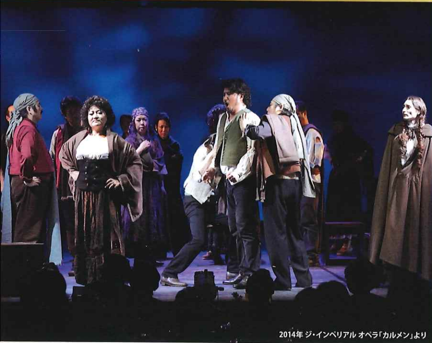
2014年 ジ・インペリアル オペラ「カルメン」より