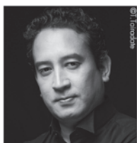
指揮 | 柴田真郁

誰もが知る民話が名作オペラとして生まれ変わった「夕鶴」の感動を、ぜひ改めてご堪能ください。